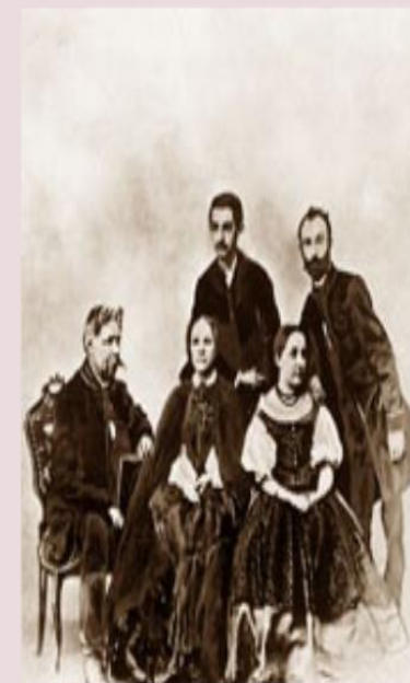
József Attila családja